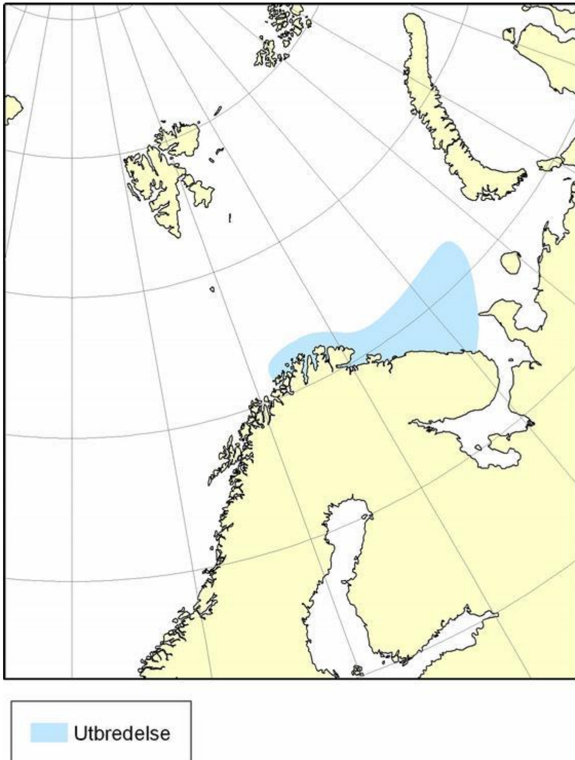
Figure 2. Distribution area of King crab. Map from www.imr.no