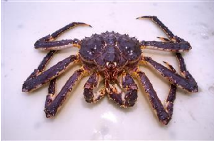
Figure 1. King crab ( Paralithodes camtschaticus ).

I Norge ble den første kongekrabben tatt i Varangerfjorden i januar 1977, 150 km fra utslippsstedet i Russland. I norske farvann har den i dag sitt hovedutbredelsesområde langs kysten av Øst-Finnmark og Tana, og den ser ut til å spre seg vestover. I 2009 var det et registrert tilfelle av den ved Sotra utenfor Bergen, men denne var trolig satt ut lokalt. Utviklingen har medført store problemer med bifangst av kongekrabbe, særlig i de tradisjonelle garnfiskeriene i nord.