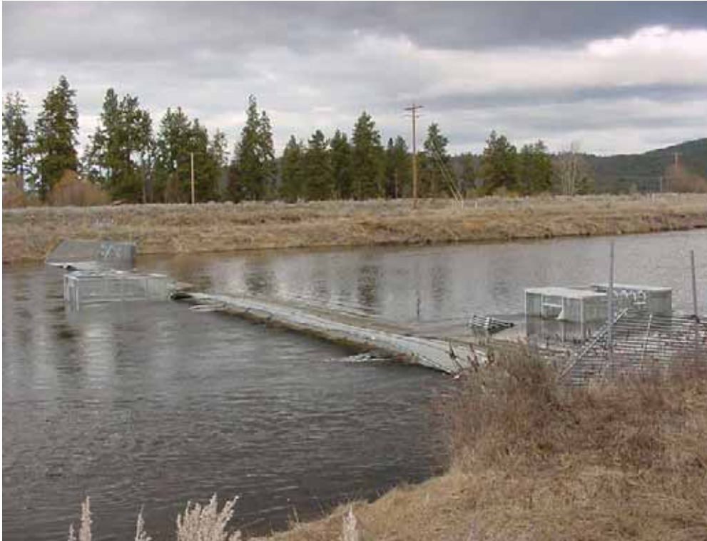
Figur 4. Eksempel på laksegjerde i elv i Canada med sorteringsstasjon for uttak av oppdrettslaks.

( http://www.vaki.is/media/files/Riverwatcher%20brochure%202005%20comp.pdf ), men vi kjenner ikke til at det er ferdig utviklet utstyr hvor slik bildeanalyse er koplet til en automatisk sortering. Imidlertid finnes planer for elvegjerder og automatiske sorteringsstasjoner på tegnebrettet ( http://www.biosort.no ), og med klipt fettfinne hos oppdrettslaks vil utsorteringene kunne gjøres mer nøyaktig og med enklere billedanalyser og algoritmer.