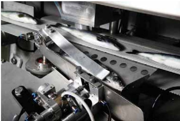
Figur 5. Detalj fra Maskon AS hvor en fettfinneklipper kan tenkes installert ( www.maskon.no ).

http://www.maskon.no/ og http://www.nmt.us/products/afs/afs.shtml ).