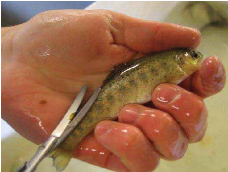
Figur 5. Klipping av fettfinne med saks. (Foto: Lars-Eric Lindqvist).

Den norske vaksinemaskinprodusenten Maskon AS anslår imidlertid at de kan tilpasse en fettfinneklipper til eksisterende vaksinemaskin med en utviklingstid på under ett år (Halvard Andresen, markeds- og utviklingssjef, Maskon, pers. komm., www.maskon.no ) Andre vaksinemaskinprodusenter er ikke forespurt.