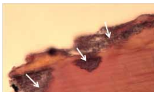
Figur 3: Snitt av skall fra syk amerikansk hummer. Ansamlinger av bakterier ser ut til å tære opp skallet (piler).

Skallsyke hos hummer representerer et såkalt syndrom, dvs. en kan ikke peke på en spesiell sykdomsorganisme som forårsaker sykdommen.