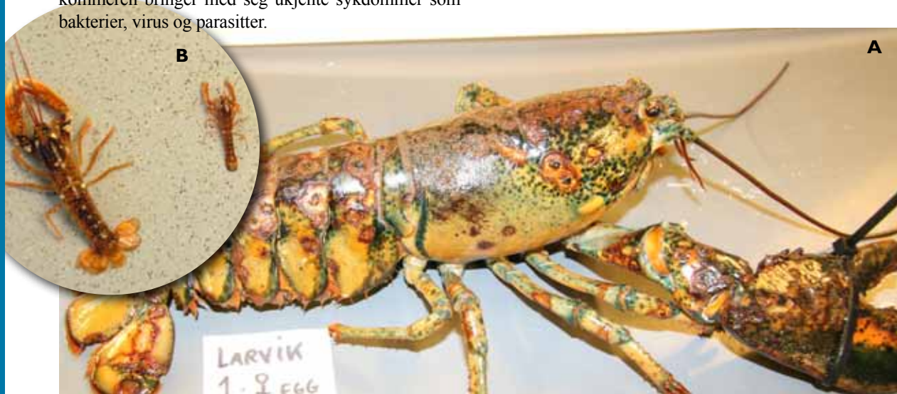
Figur 1 A: Amerikansk eggbærende hunnhummer med lesjoner karakteristisk for skallsyke.

Amerikansk hummer ligner utseendemessig vår egen art, europeisk hummer ( Homarus gamarus ). Hummer er en viktig sjømatressurs, og på grunn av reduserte fangster av vår egen art har det de siste tiårene vært en økning i import av amerikansk hummer til Europa. Funn av kun 24 amerikanske hummere i norske farvann over en periode på ti år kan gi inntrykk av at risikoen for spredning av gener og sykdom generelt er meget liten, men funn de siste to årene gir dessverre et annet bilde.