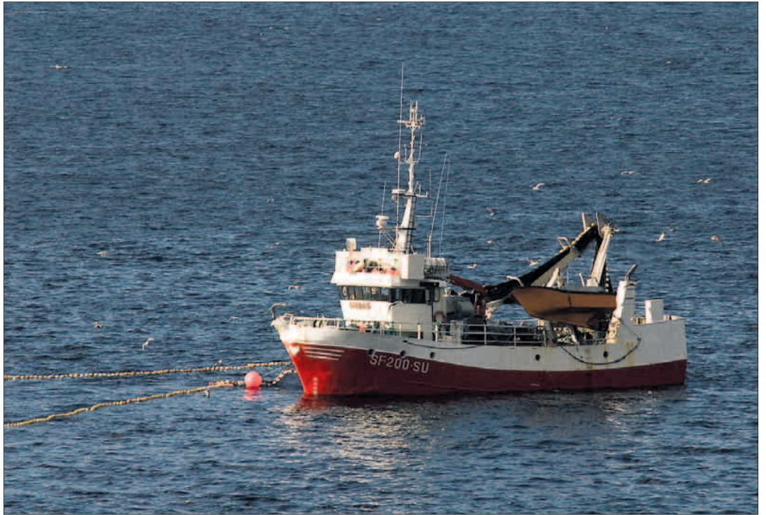
TVILER: Norges Fiskarlag tviler sterkt på om havforskerne har oversikt over de ulemper og skadevirkninger seismiske undersøkelser utsetter fiskebestanden for.

– Ja, det følger med en del støy som skremmer vekk større fisk. Men seismikk er ikke farlig, og stor fisk tar ingen skade. Yngel og larver derimot blir forstyrret. Vi skal likevel huske på at den døde-