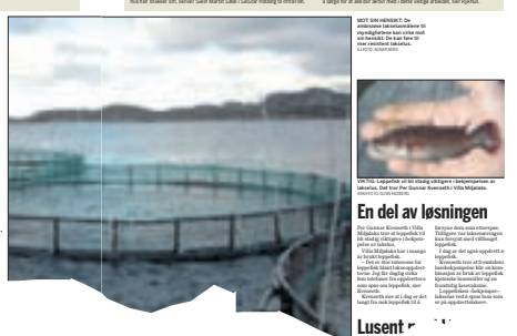
En del av løsningen

Det har blitt gjort mye forskning på lakselus, og det er viktig å vite hva som fungerer og hva som ikke fungerer. Det er viktig å vite hva som fungerer og hva som ikke fungerer. Det er viktig å vite hva som fungerer og hva som ikke fungerer.