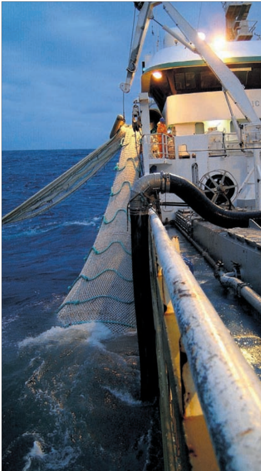
FANGST: Ringnotfartøy som fisker kolmule. I 2010 kan fangsten bli ytterligere redusert.