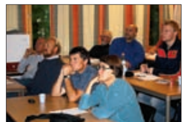
Stor interesse fra salen.

Men om olje- og gassvirksomhet i framtida kan foregå uten denne typen utslipp, så kan ingen gi noen garanti mot uhell. Spesielt ikke når virksomheten skal drives i farvann som byr på store vær- og temperaturmessige utfordringer.