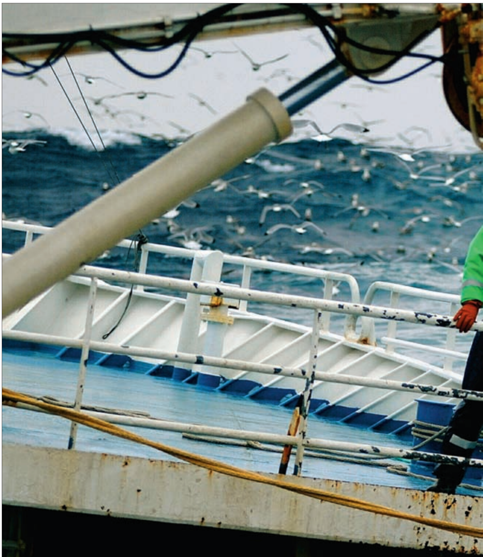
BRUTTE LØFTER: Forskning på følgen av å skyte seismikk utenfor Lofoten og Vesterålen har falt ut av statsbudsjettet. ILLUSTRASJONSFOTO

I Trøndelag får Utvorda 1,7 millioner, mens Sandnesvågen får tilskudd til kommunal fiskerihavn. I Møre og Romsdal skal farleia slutføres i Røyrasundet, mens Nordvik og Sandhamn får bedre fiskerikaier. For Gunhildsvågen i Flora går det med 48 millioner, mens Bekkjarvik i Austevoll får 4,2 millioner. Rogaland får ingen utbedring av sine fiskerihavner neste år.