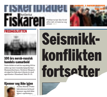
Fiskeribladet Fiskaren 19. september 2008.

Regjeringen bevilger ingenting ekstra på budsjettene til forskning på konsekvensene av seismikkskytinga utenfor Lofoten og Vesterålen.