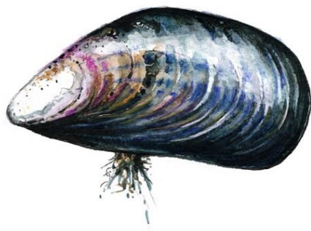
Illustrasjon: Stein Mortensen

Det er rapportert om dødelighet av blåskjell også fra Nederland og Frankrike, i noen tilfeller med mistanke om sykdom. Fremover ser vi et behov for å kartlegge og beskrive nedgangen i blåskjellforekomster langs norskekysten og undersøke tilfeller av akutt dødelighet i blåskjellbestander.