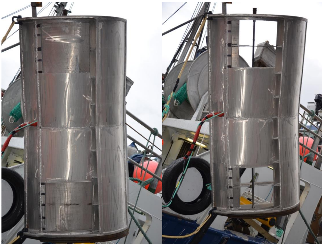
Figur 1. Baksiden av tråldøren med lukene lukket og åpnet

Til forsøket hadde Egersund Trål AS konstruert og produsert et multifoil tråldørsett på 2 m 2 i aluminium. Vekten på dørene var 180 kg inklusive vekter. I hver dør var det laget to luker på 0,2 m 2 , som tilsvarer ca 20 % av dørarealet. Se bilder av tråldøren i Figur 1.