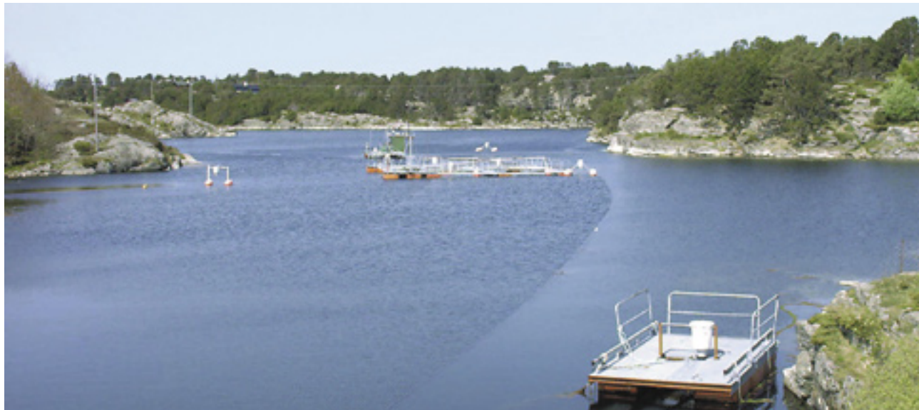
Poll ved Havforskningsinstituttets feltstasjon Parisvatnet.