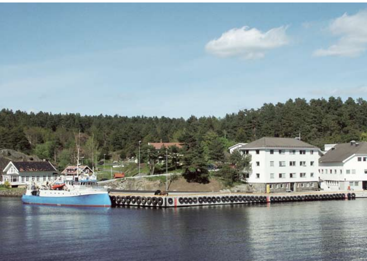
Forskningsstasjonen Flødevigen og fartøyet "G.M. Dannevig", oppkalt etter stasjonens opphavsmann.

Det er nå planer om en oppgradering og utbygging av forskningsstasjonen for ytterligere å styrke mulighetene til forskningsaktivitet av høy internasjonal standard. Målet er at nye og oppgraderte akvarie-, kontor- og laboratoriefasiliteter skal være innflytningsklare i løpet av 2008. Kostnadsrammen beløper seg til ca. 25 millioner kroner.