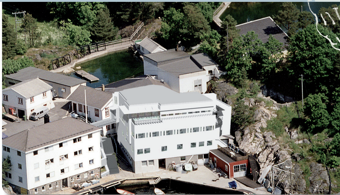
Figur 1 Slik blir det når nybygget står ferdig.