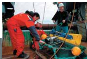
Tobisundersøkelser i Nordsjøen: Det står dårlig til med bestanden.