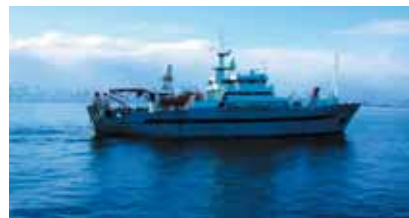
Silda kommer inn fra Norskehavet for å gyte. På tokt langs norskekysten våren 2006 fant Havforskningsinstituttet 92 billioner sildelarver.