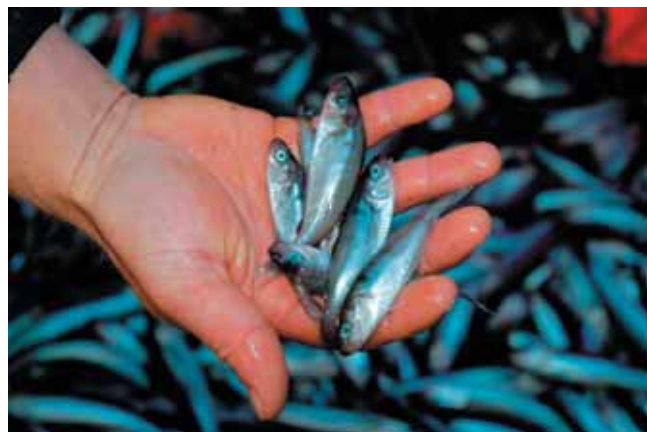
In the Norwegian Sea, commercial vessels are used for herring and whale surveys.