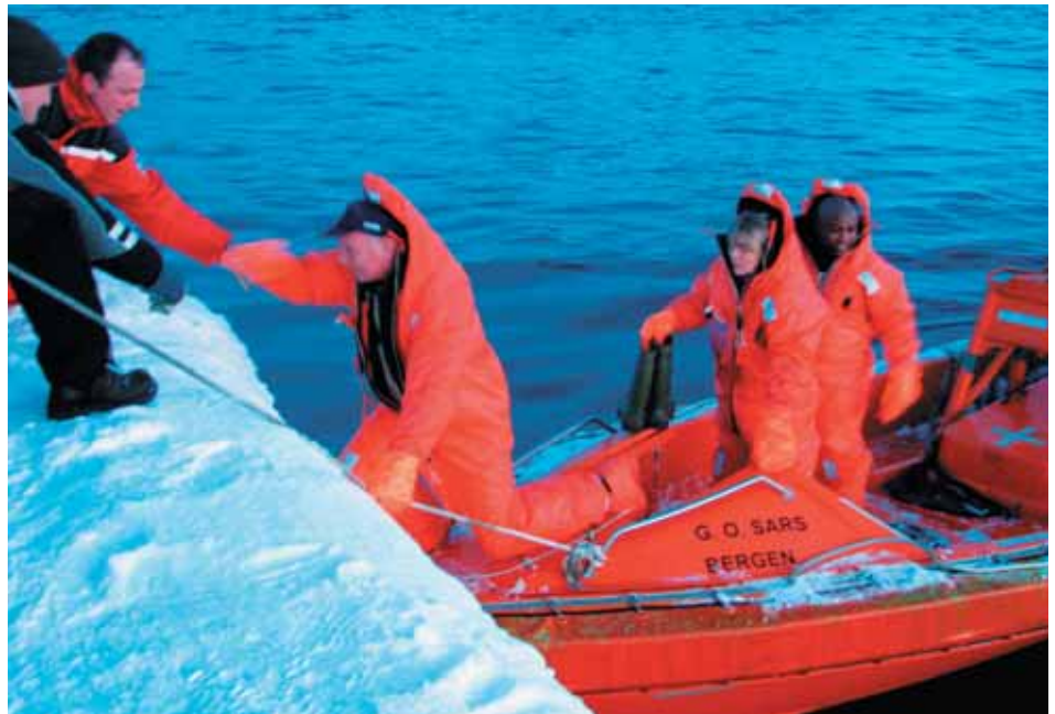
On shore at Bear Island during a survey in the Barents Sea.