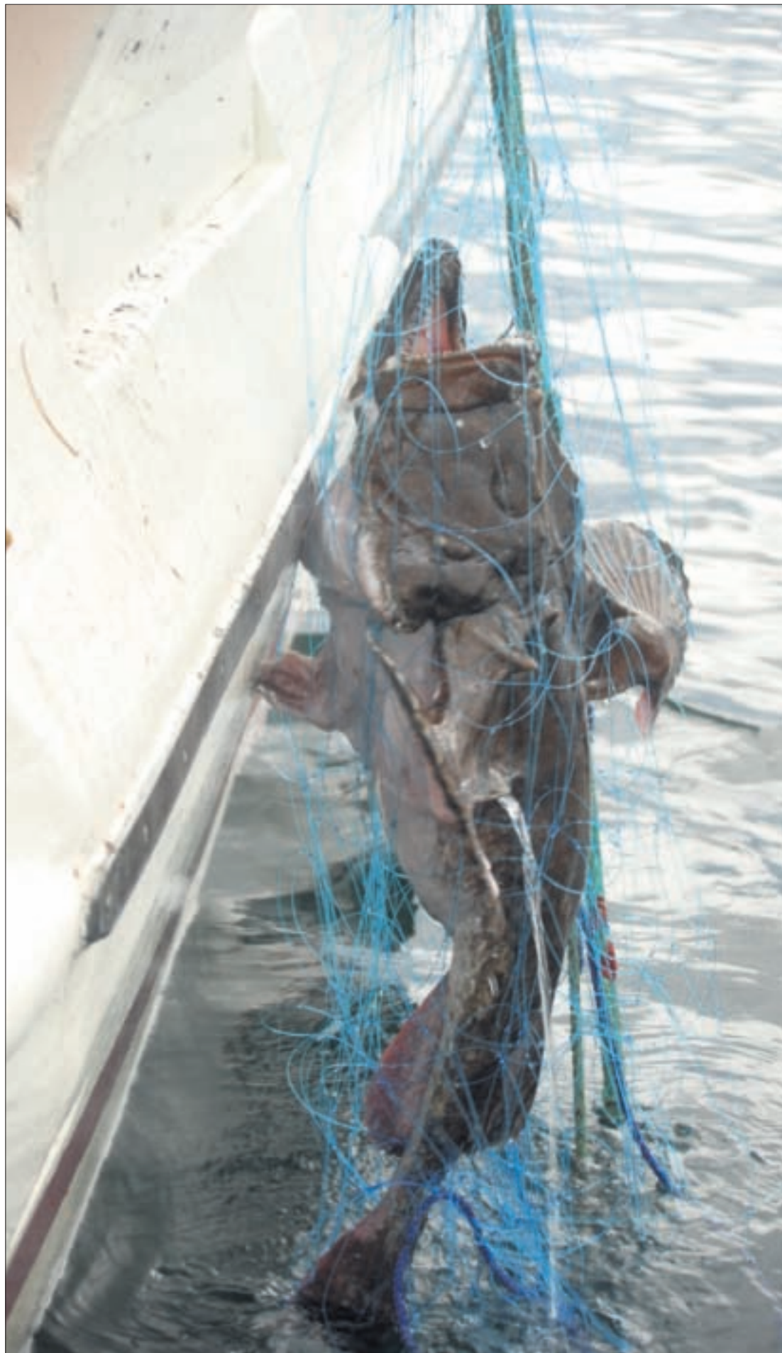
FREDET: FKD tar levebrødet fra fiskere med lavest driftsgrunnlag i Midt-Norge når de innskrenker fisket etter breiflabb av hensyn til kveita.

einair.lindbak@fbfi.no Telefon: 93 25 63 23