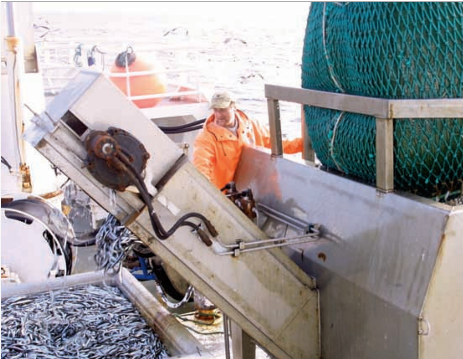
Tobis fangster Norske fartøy, levert i Norge